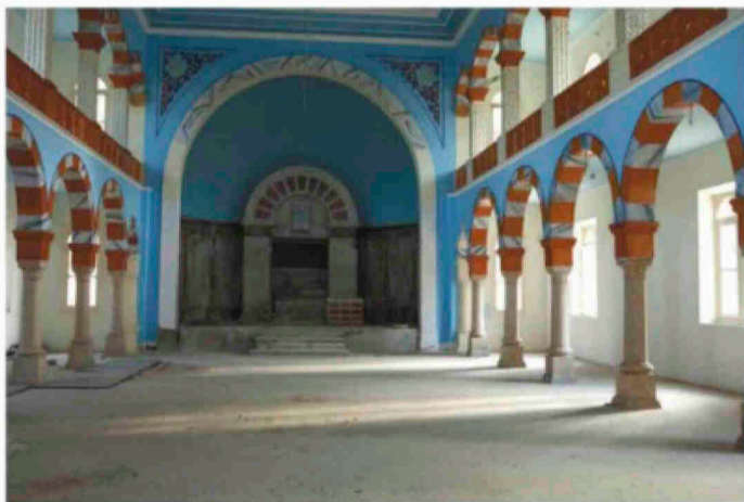
בית הכנסת מגן אברהם, ביירות 2010. צילום: Sam Tarling/Corbis via Getty IL. דויד

על הפער בין תצלומי בית הכנסת שנראים ברשת, שמראים מקום מפואר ויפה, לבין התמונה המורכבת ומעט מנלכלית שמציג זליכה, הוא אומר שזו החלטה מודעת שלו. "הרשיתי לעצמי לקחת זום-אאוט מהנרטיבים הס' פציפיים ולבחור את המסלול שלי. אני לא נולדתי שם וגם לא הייתי חייל במלחמה הזו. פשוט שמעתי סיפור אחד והתעניינתי לשמוע עוד, ואז החלטתי לעבד את הסיפורים למשהו חדש. זה מיצב אמנותי מבוסס חוויה, שמוצג כתערוכה".