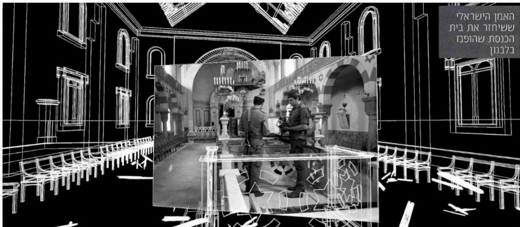
מתוך התערוכה בלבנון המדרשה בתל אביב. מבוסס על הזיכרון, לא על התוכנית האדריכלית.